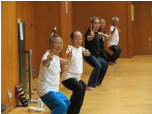
男性役員リードによる八段錦(1～4段)