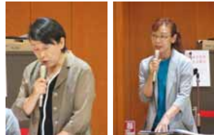
事業事業計画(案)・収支予算(案)報告状況