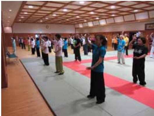
全員による椿拳の練習